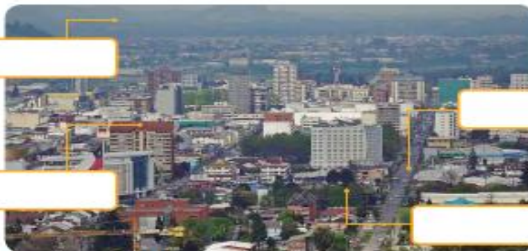
▲ Temuco, región de La Araucanía, Chile.

5.- Describe las siguientes imágenes con los conceptos leídos anteriormente.