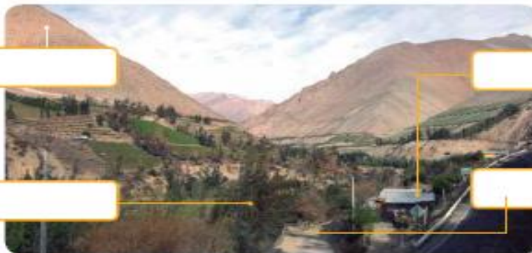
▲ Valle del Elqui, región de Coquimbo, Chile.