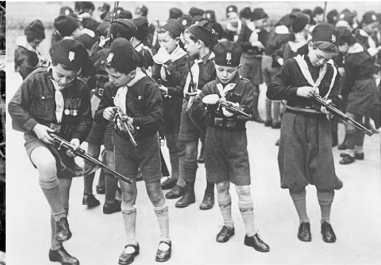
Imagen 1: Gulag, campos de trabajos forzados soviéticos Imagen 2: Juventudes fascistas italianas