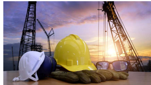
Fuente: Adaptado de Flores, N. (1 de abril 2013). radio.udechile.cl

En fallo unánime, la Corte Suprema ratificó el fallo de la Corte de Apelaciones de Valparaíso e contra de proyecto “Costa Esmeralda” por acopiar material en una zona protegida. “Así, al no haber cumplido con dichas obligaciones, su actuar se torna ilegal, lo que conduce a acoger la presente acción cautelar de rango constitucional, toda vez que los hechos establecidos afectan efectivamente el derecho de vivir en un medio ambiente libre de contaminación”, sostuvo el tribunal de alzada porteño en la sentencia.