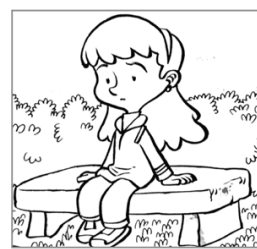
Acompañar al que