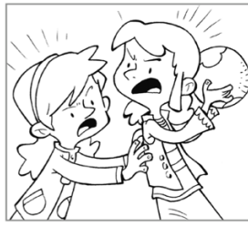
Compartir con mis