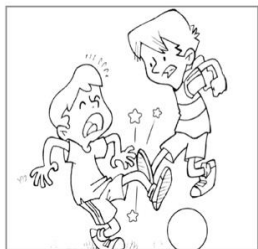
No pegarle a mi

El amor a Dios no es completo si no amamos a los demás.