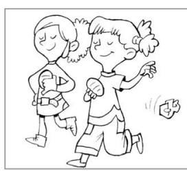
No tiraría basura