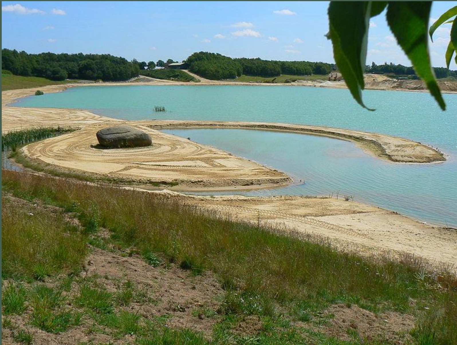
Broken Circle and Spiral Hill (1971)