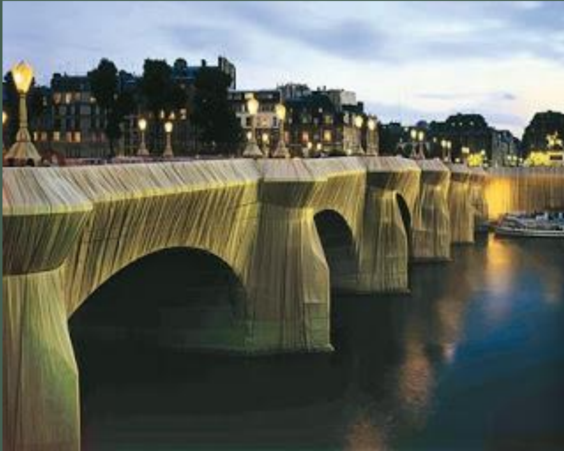
El Pont Neuf envuelto en tela por Christo y Jeanne-Claude.

En agosto, la pareja obtuvo el permiso para cubrir el Puente Nuevo, tras nueve años de negociaciones con el alcalde de París, Jacques Chirac. Para envolver la estructura se necesitaron 40.000 metros cuadrados de tela poliamida color arena. El 22 de septiembre de 1985, el proyecto había finalizado. En las siguientes dos semanas, más de tres millones de personas visitaron la obra.